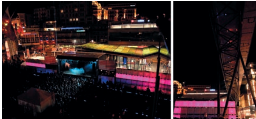
Installation urbaine / Label Suisse & M2 / Lausanne 2008.

Installation vidéo & lumière pour la piscine d'un chalet de luxe en Valais 2008. Architecte intérieur: Adeli & De Rahm / Lausanne-Dubaï.